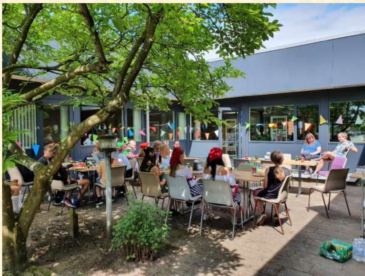
Rigtig god vind til 6A