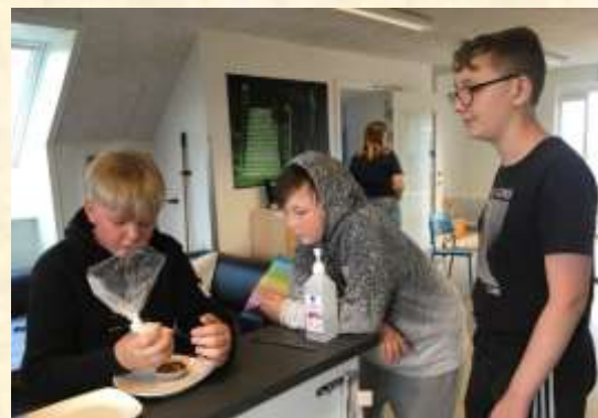
Der hygges i aftenklubben ☺