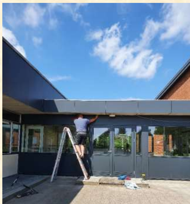
Erling tager over efter håndværkerne og ordner de sidste finesser