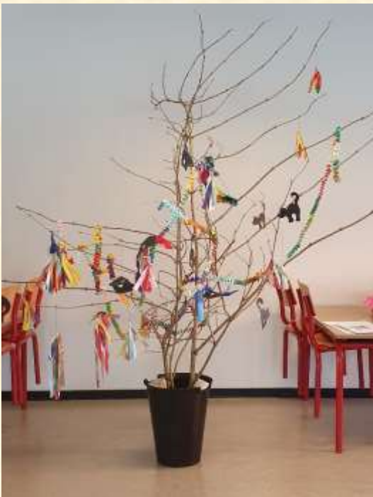
2A har pyntet et stort fastelavnsris

0.-4.klasse blev budt velkommen tilbage i skole med en fastelavnsfest, hvor der både var tøndeslagning, fastelavnsboller og kakao. Der er desværre ikke noget billede af 4A, da de havde slået tønden ned og pakket sammen, inden fotografen nåede frem. Det tog lidt længere tid for de yngste at få klaret den opgave ☺