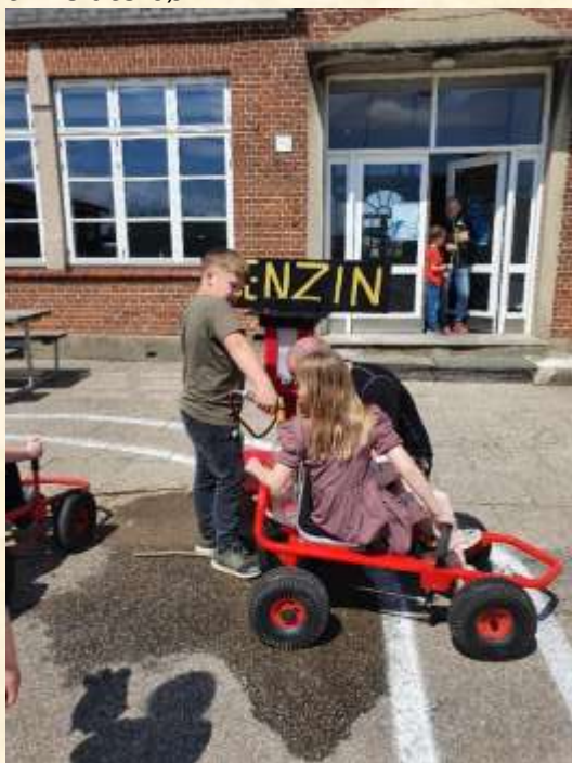
Når vores mooncar løber tør for brændstof, er det godt, at de voksne har bygget en benzinstander, som børnene selv kan betjene ☺

Der er lukket i SFO i uge 28, 29 og 30. I uge 26, 27 samt 31 er Fritidshuset åben for tilmeldte børn.