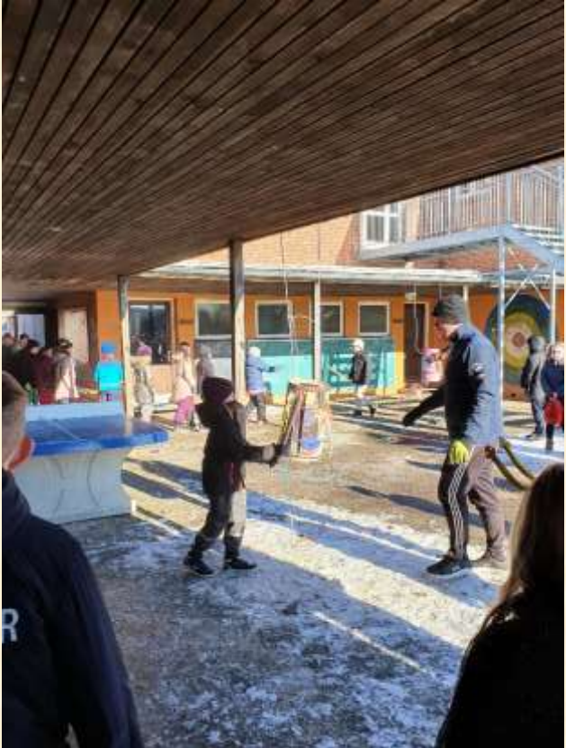
Slå til 1A!!