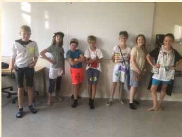
Designtalenterne i 4A udfolder sig 😊