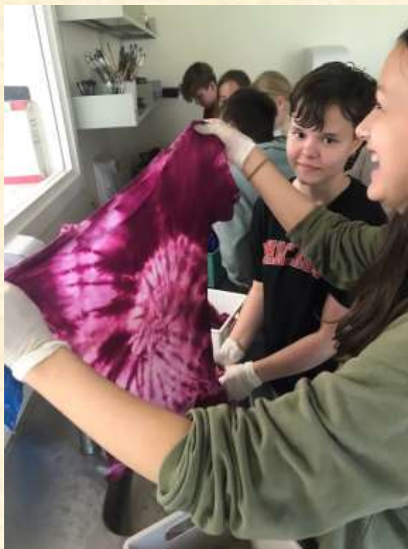
6A laver flotte batikbluser