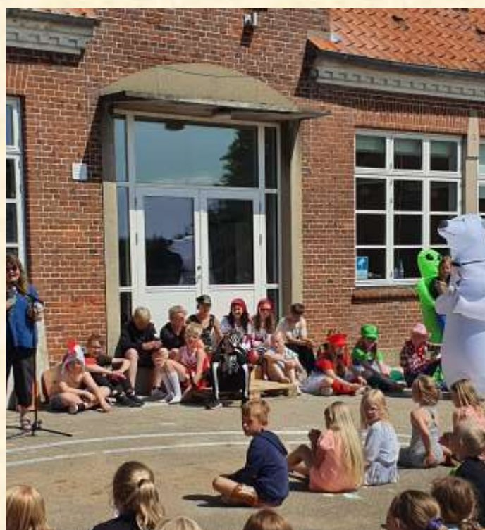
Sidste skoledag med rundbold, feriesang og afslutningsfrokost med skønne 6A