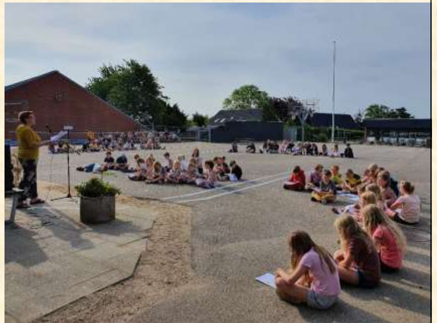
.....så blir' der danset