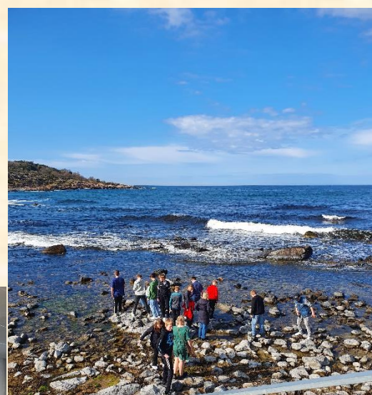
Vejret var med os de fleste dage