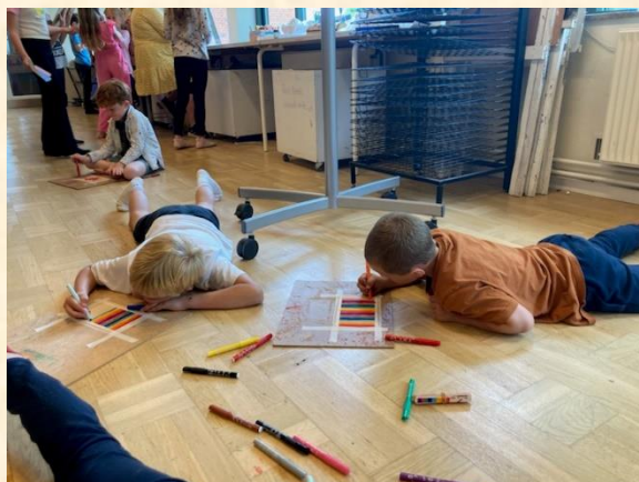
Fuld koncentration på gulvet i billedkunst