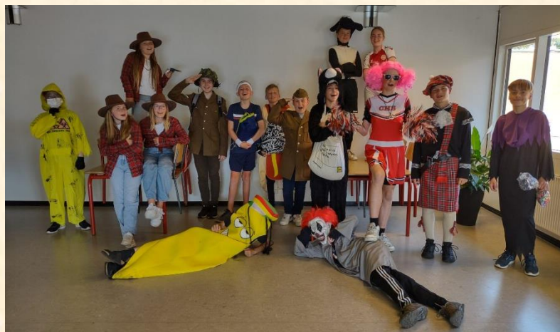
Tak for syv gode år, kære 6A. Vi ønsker jer alt det bedste på jeres videre rejse.

Mange venlige hilsner og rigtig god sommer