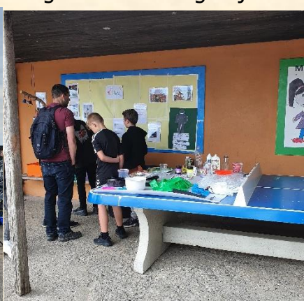
4A havde arbejdet med plastik i ugens løb