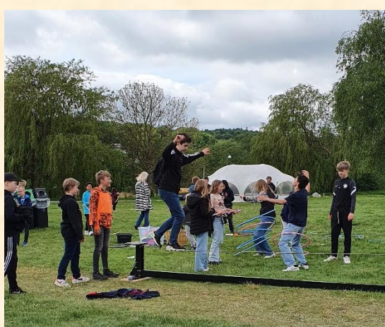
Optræden på line og med hulahopringer..