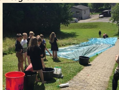
Kælkebakke om vinteren – Glidebane om sommeren