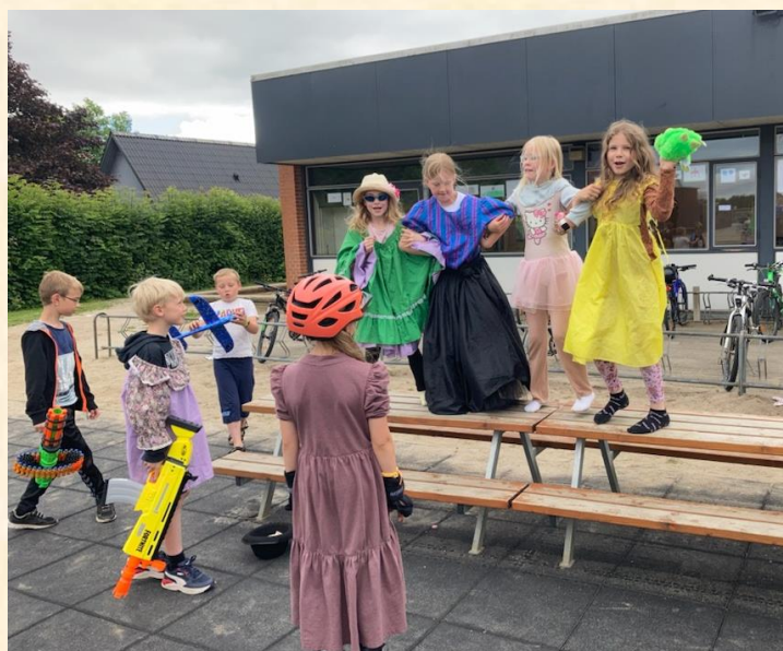
2A gir' den gas ved indskolingens legetøjsdag