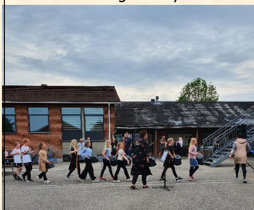
3A leverede stomp