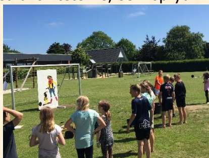
Lang kø for at ramme 6A med vandballoner