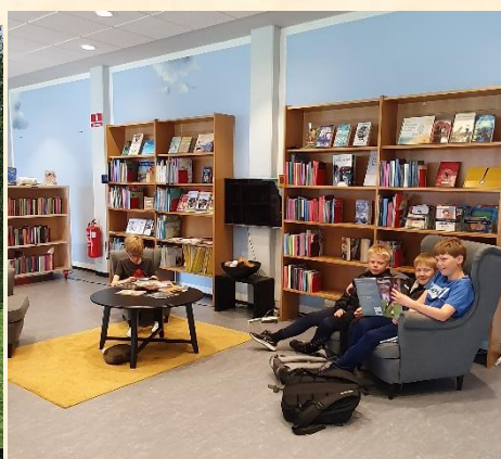
Man bliver ikke for gammel til leg og læsning på biblioteket i Vejle ☺