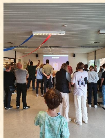
Og vinderen er .....