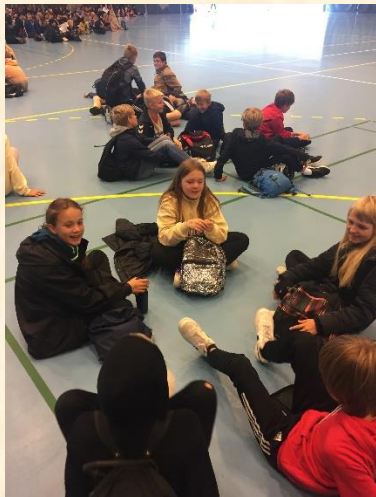
Der er lidt ventetid, når 1002 elever skal på plads ;-)