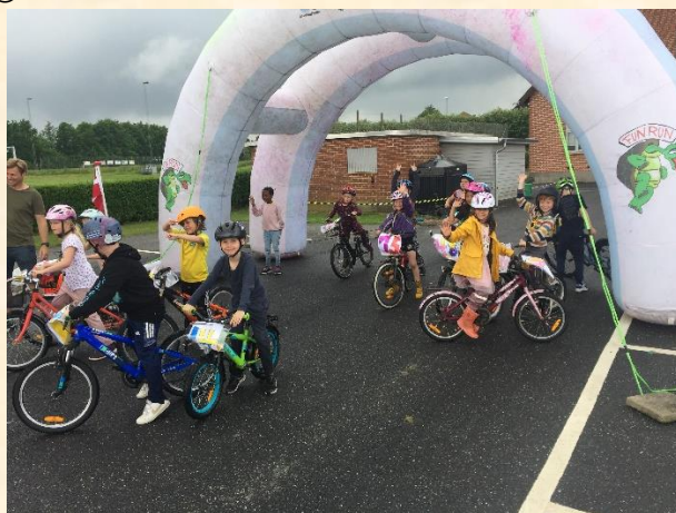
Jeg er så glad for min cykel.....