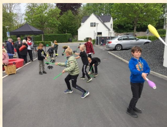
Man skal øve sig længe for at blive god til at jonglere....