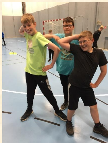
Backstreets back alright!

Samarbejde og bevægelse var nøgleordene, da 5A tog til den fælles idrætsdag i DGI-huset i Vejle sammen med kommunens øvrige 5.klasser. Over 1000 elever deltog og selv om det gav lidt udfordringer for arrangørerne, så var der kun smil på læben på drengene og pigerne fra Gårslev.