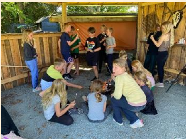
3A afslutter N/T og det foregår selvfølgelig udenfor med mad på bål