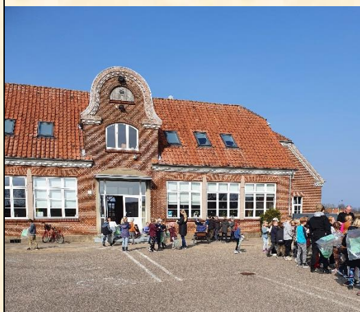
Der udleveres poser og handsker, inden kampen mod affald sættes i gang

Fritidshusets børn har været med i "Affaldsindsamlingen 2022", hvor vi brugte to eftermiddage á et par timers varighed til opgaven med at samle skrald i Gårslev. Affaldet skulle først indsamles, derefter sorteres og til slut vejes. Vi fik samlet lige omkring 15 kg affald i løbet af de to eftermiddage. Super godt gået 😊