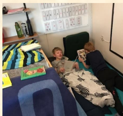
Hyggelæsning i 3A