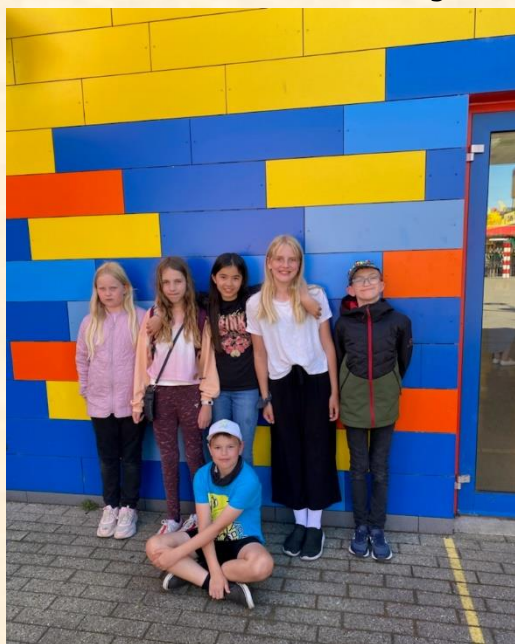
Smil til fotografen