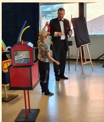
Både børn og voksne skulle hjælpe med at trylle