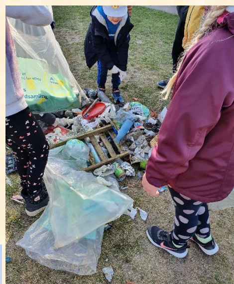
Pyha, så skal der sorteres....