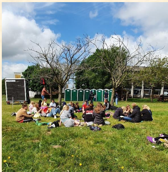
Mellemtrinnet spiser madpakker i solen, inden turen går tilbage til Gårslev