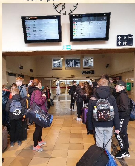
Det var mest på hjemturen båden gyngede