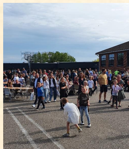
Liv og glade dage i skolegården

Skolefesten var i år lavet om til en skolefestival, hvor alle aktiviteterne foregik inde og udenfor på skolen. Vi var så heldige, at regnen blev væk fra Gårslev denne aften. Der var super gode musikalske optrædener fra alle klasser, og flere elever fra 5. og 6.klasse var gået sammen for at skrive deres eget skuespil, som de præsenterede for os alle sammen. Der var forskellige udstillinger, boder og spil, som både store og små prøvede kræfter med. Det er virkelig dejligt at opleve den enormt store opbakning, der er fra jer familier til at støtte op om skolens arrangementer. GSV stillede endnu en gang op, og sørgede for både grillpølser og kage, så ingen gik sultne hjem. Hvordan skolefesten ser ud næste år, ved vi endnu ikke, men vi håber i hvert fald, at vi kan planlægge ud fra vores ønsker uden at skulle tage hensyn til smittetal og corona retningslinjer 😊