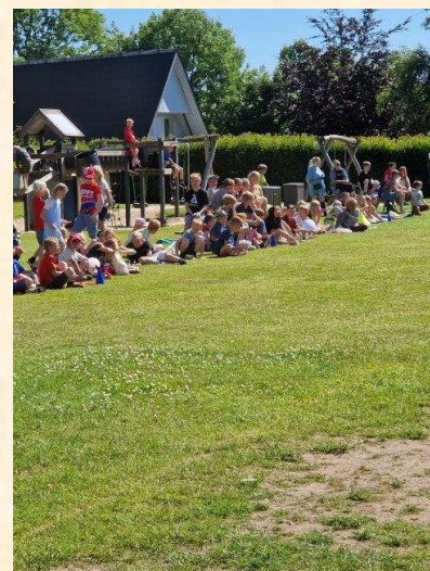
Selv om alle børn vist heppede på 6A, var det alligevel de voksne, der vandt fodboldkampen ..... måske fordi vi havde en stærk mur? ☺