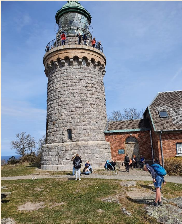
Hammerknuden rundt og en tur op i Hammeren Fyr