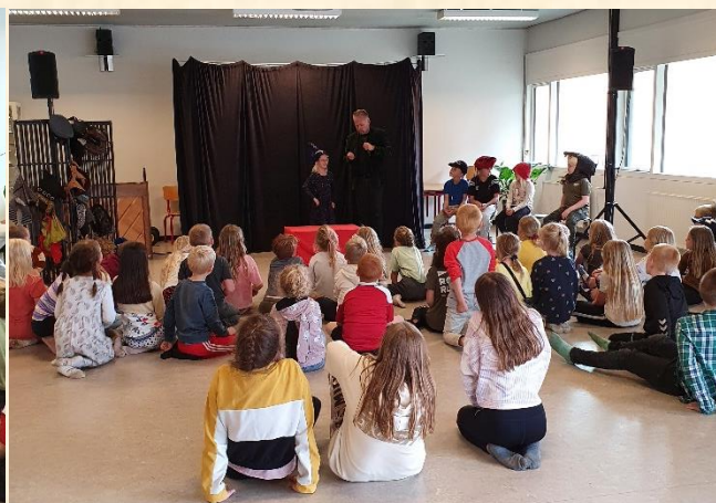
Skønne skuespillere og et interesseret publikum