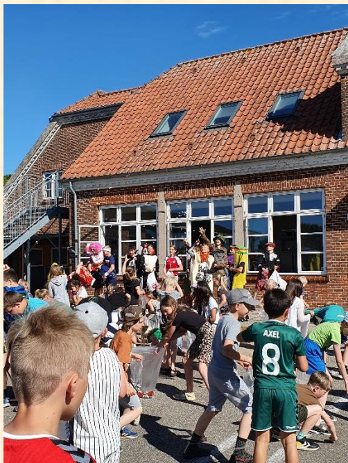
6A havde taget mange karameller med.