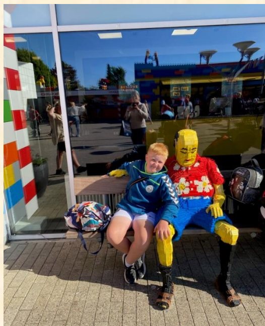
To gutter tar' et lille hvil på bænken ☺

I løbet af august skifter vi fra, at børnene tjekker ind og ud i Tabulex til, at det skal gøres i et tilsvarende "Komme-gå" modul i AULA. Dette vil være gældende for alle SFO'er i Vejle Kommune.