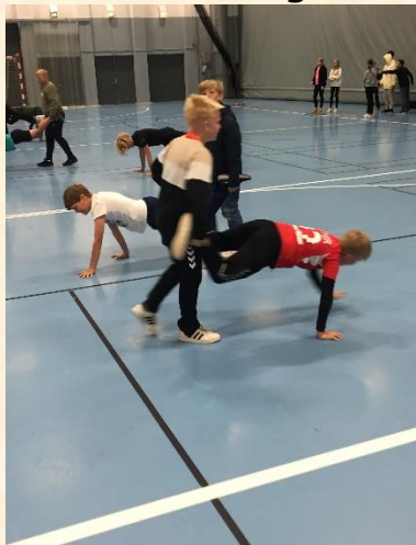
At køre trillebør kræver både styrke og samarbejde