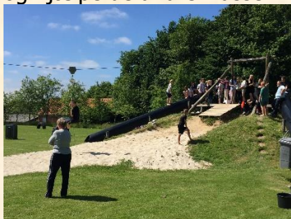
Tålmodige børn venter på en svævetur

lavet en sjov dag for dem med nogle gode aktiviteter. 6.klasse var rigtig gode til at guide og hjælpe de andre klasser med aktiviteterne, selv oprydningen tog de i stiv arm.