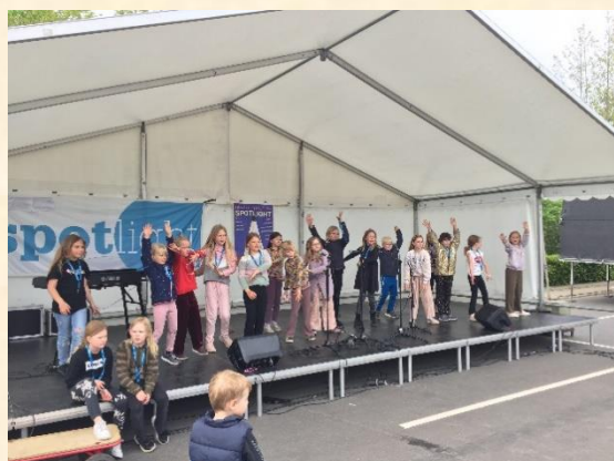
En del elever fra Gårslev var ikke til at hive ned af scenen igen