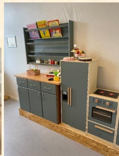
Genbrug er godt. Der slibes på livet løs til nyt legekøkken i Fritidshuset.