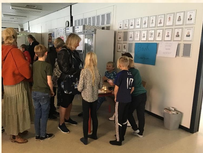
Der er kø foran banken, hvor der veksles til Gårslevgrunker

Tusind tak for det flotte fremmøde og tak til Minibyens borgere for deres store indsats ☺