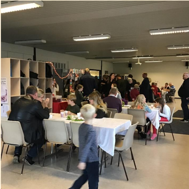
Tid til kage og hygge for børn og voksne i cafeen