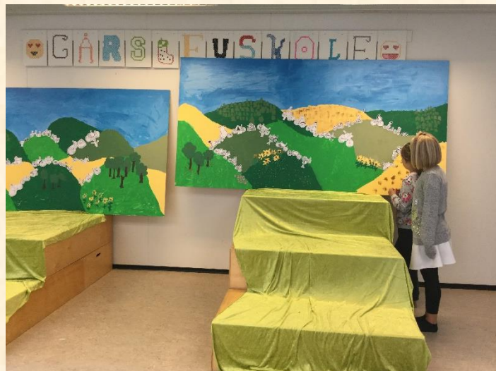
Der klargøres til kunstudstillingen

Igen i år har vores elever bidraget til Gårslev Kulturklubs årlige udstilling på Gårslev Skole. En udstilling, der trækker folk til fra nær og fjern. I år var overskriften "Tour de kunst" med masser af cykler i byen som blikfang. Vi er glade for det gode samarbejde mellem skole og kulturklub, som giver mulighed for at lave og vise kunst i børnehøjde.