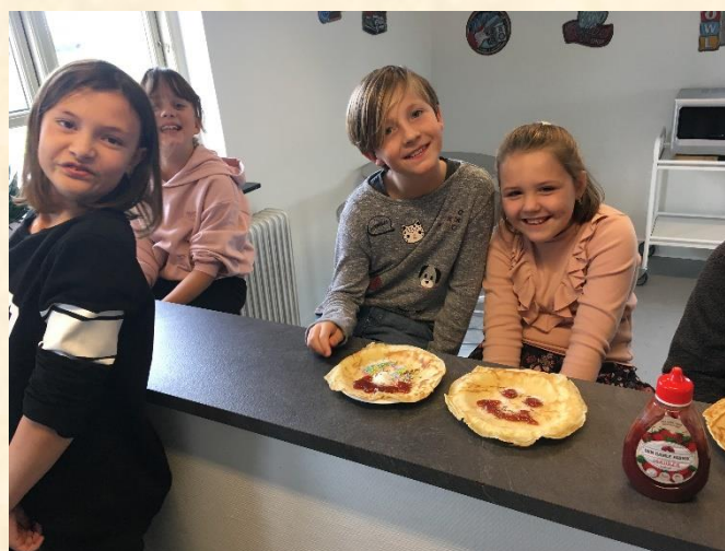
Pigeklubben er i gang: Pynt din muffin så flot som muligt og lav din egen pandekage-smiley