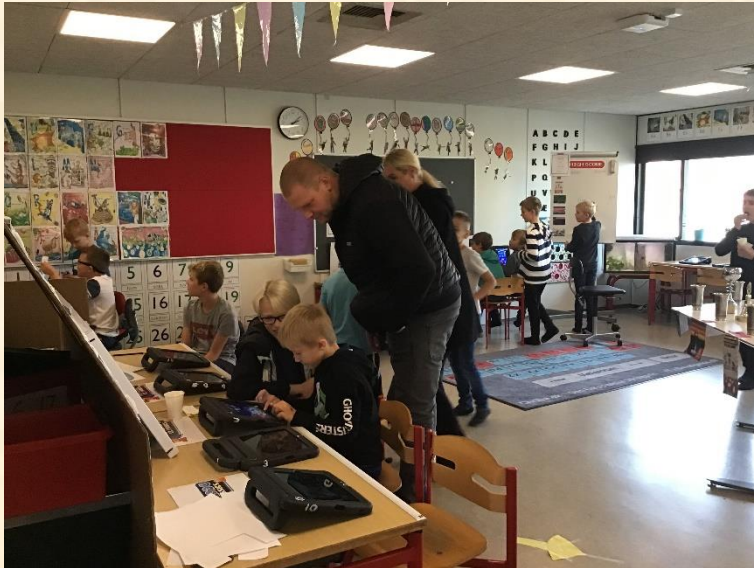
Spilarkaden har ugen igennem været et tilløbsstykke.