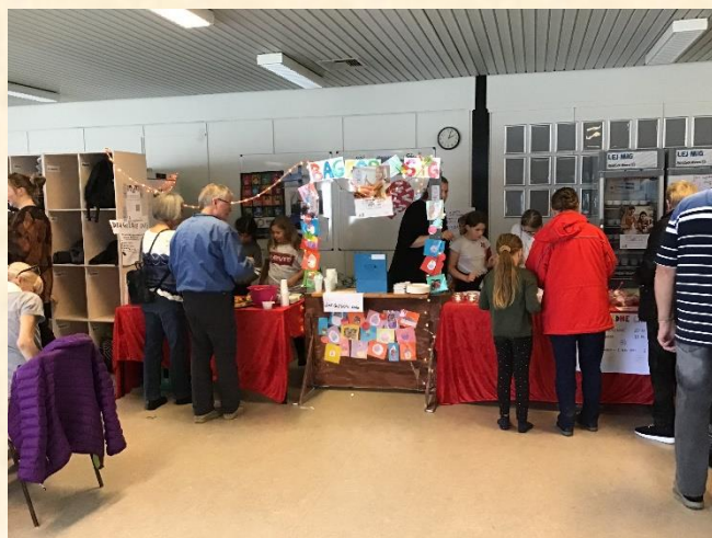
"Den gyldne café" sælger kager til fordel for "Bag for en sag" og børnetelefonen