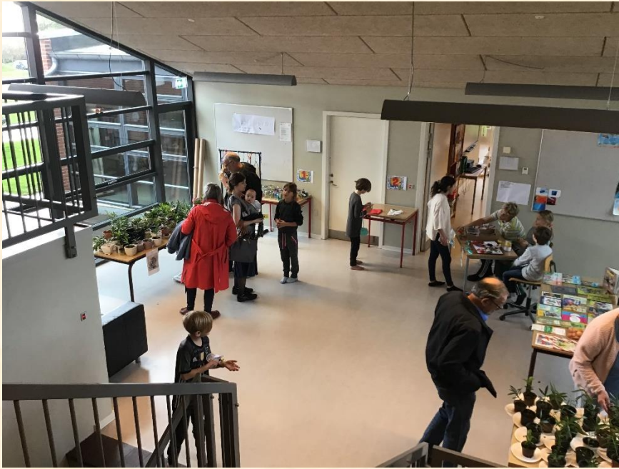
Genbrugsbutikken har tryllet hele ugen og kunne fremvise et flot og bredt varesortiment.