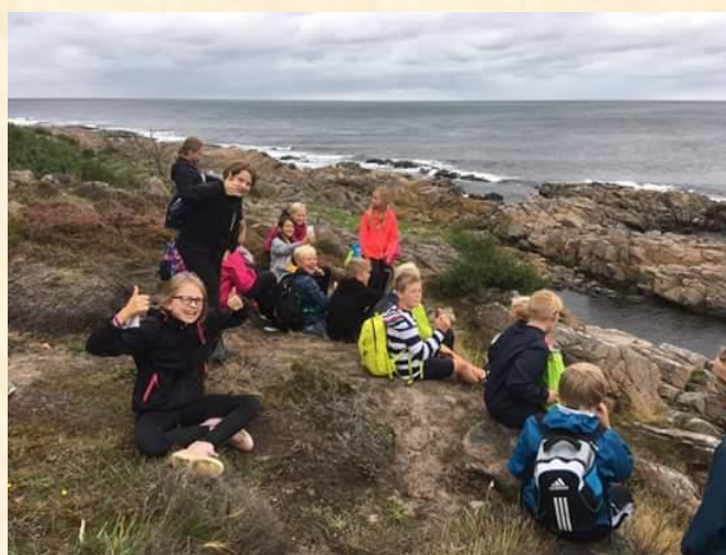
5. og 6.klasse i Bornholms skønne natur