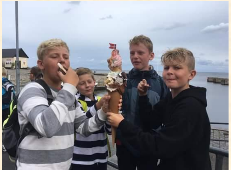
På Bornholm spiser man både røgede sild og store is ☺